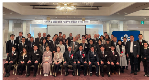
出席者の集合写真 (Group photo of the attendees)

https://fief.or.jp/about/cultural/overseas/migrants/