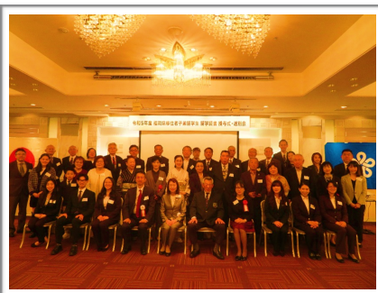
出席者の集合写真

https://kokusaihiroba.or.jp/about/cultural/overseas/migrants/