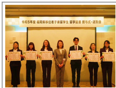
大曲理事長と記念撮影

https://kokusaihiroba.or.jp/about/cultural/overseas/migrants/