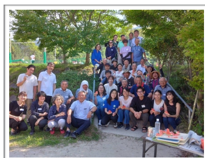
県費留学生と県家族会の初対面（6月）