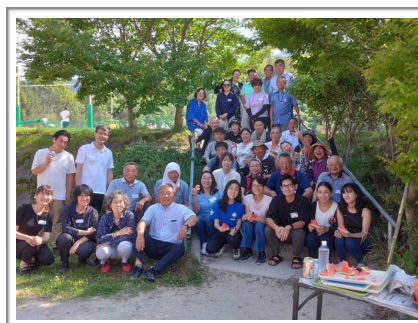
県費留学生と県家族会の初対面（6月）