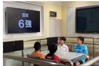
【福岡市民防災センター】