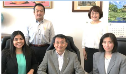
初めて当財団表敬に来られました