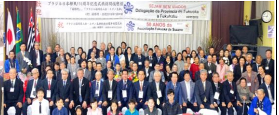
福岡県人会スザノ支部創立50周年記念式典 (2018/7/22)