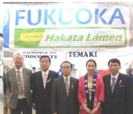
日本祭りブラジル福岡県人会ブースにて (2018/7/21)