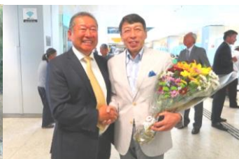
ブラジル福岡県人会平山会長と (2018/7/18)