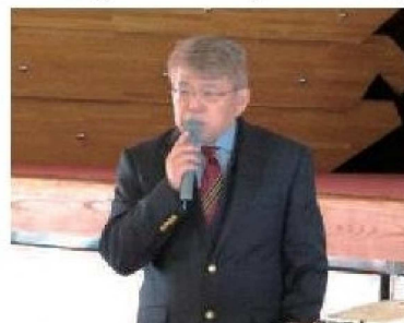
(Conferencia en el colegio Tobata)

A través de esta conferencia esperamos que los jóvenes se animen a realizar actividades en diferentes lugares del mundo.