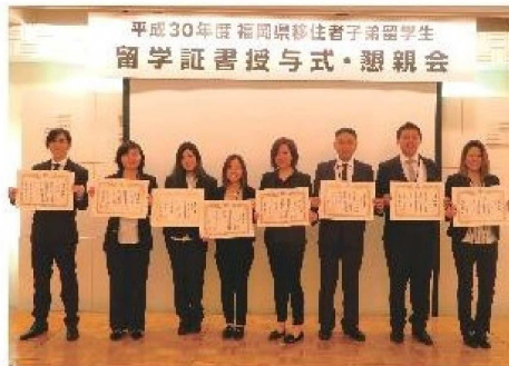
(Se ayudaron mutuamente durante 1 año en la beca)

8 estudiantes internacionales que poseen sus raíces en la prefectura de Fukuoka han culminado la etapa de estudiantes por un periodo de un año y volvieron a sus respectivos países.