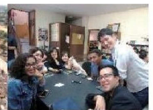
(Intercambio en la Universidad de Guanajuato)