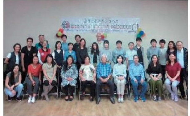
(Fiesta de bienvenida organizada por Mexico Fukuoka Kenjinkai)

A través de estas experiencias deseamos que en adelante los jóvenes sean el puente de relación entre la prefectura de Fukuoka y los Fukuoka kenjinkai de diferentes países.