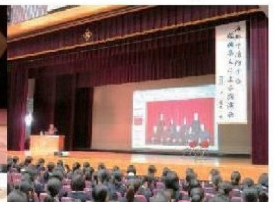
(Conferencia en el colegio Chikushigaoka)