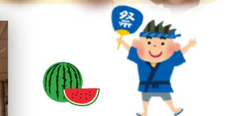
Experiência de Tocar Taiko