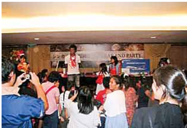
シンガポール福岡県企業会 (設立：1996年 会員数：12社、賛助会員4名)