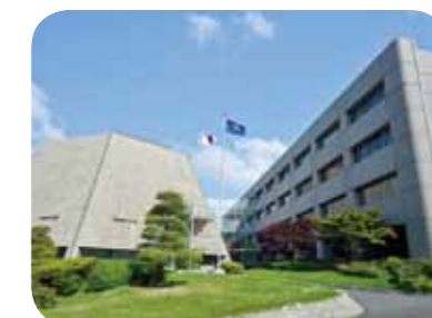
Fukuoka Prefectural Assembly Building