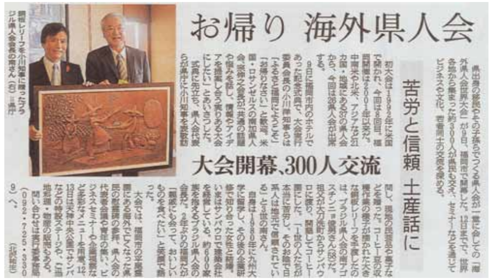
The Asahi Shimbun (morning edition), Thursday, October 10, 2013