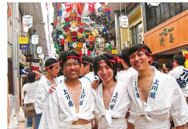
博多祇園山笠に参加