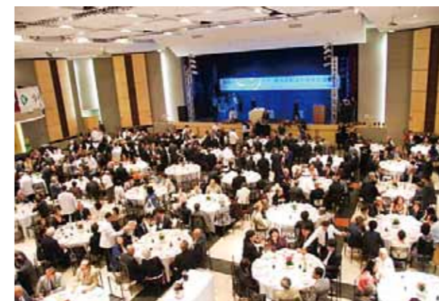
ブラジル福岡県人会 (設立: 1930年 会員数: 977名)