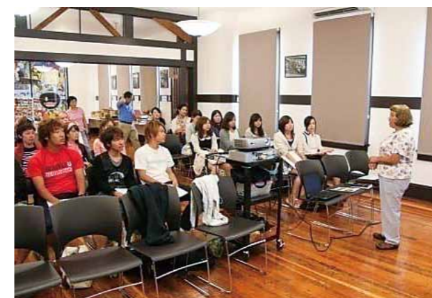
福岡大学とシアトル県人会との交流