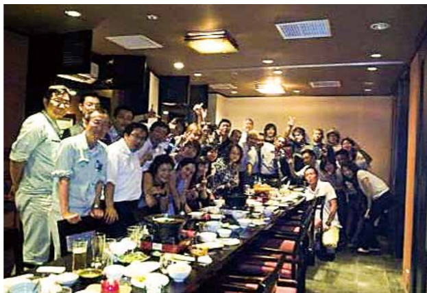
ハノイばってん会 (設立：2012年 会員数：約70名)