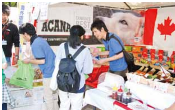
Canadian booth: Hirata Sangyo, ACANA Family Japan