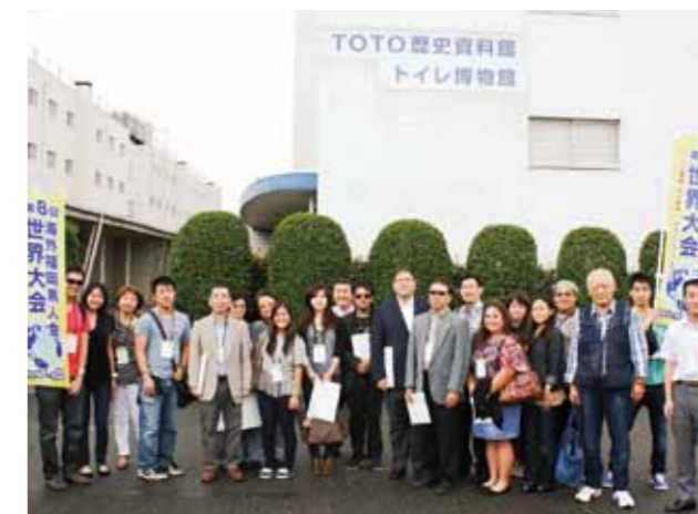
TOTO History Museum