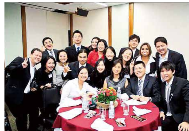
ブラジル県費留学生OB会の皆さん