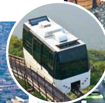
Mt. Sarakura Hobashira Cable Car