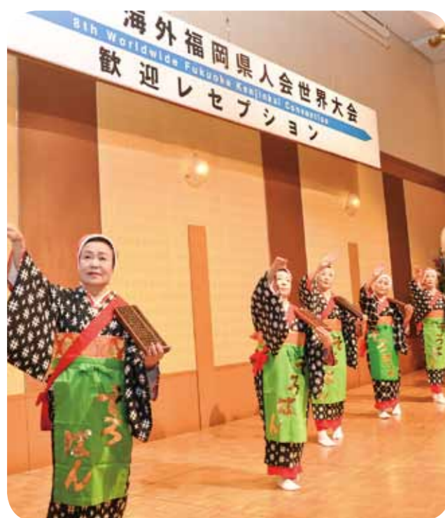
Hakata Folk Dance Society Soroban dancing