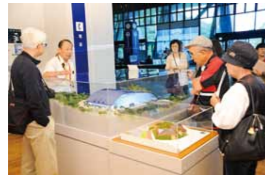
Kyushu National Museum