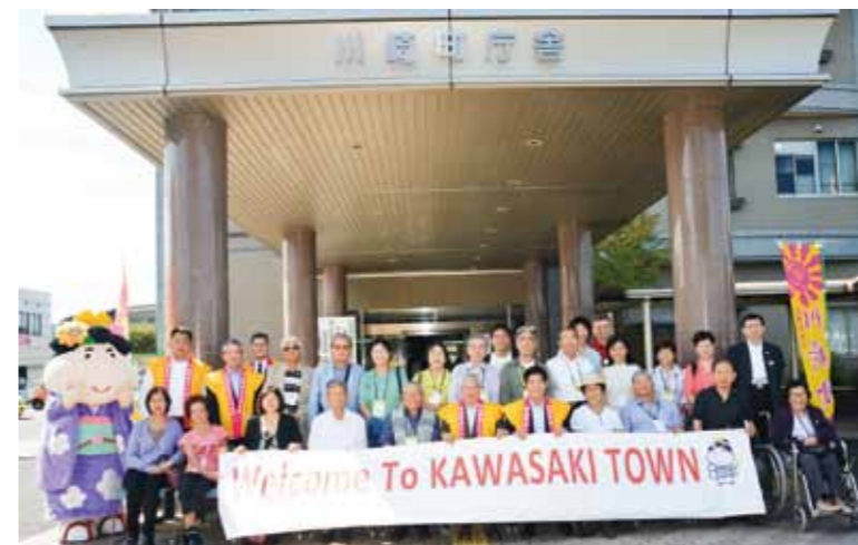
Commemorative photo with Mayor Yukio Oda of Kawasaki Town and "Koume-chan"