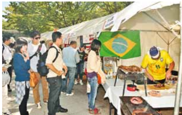
Brazilian cuisine: Rio de Janeiro