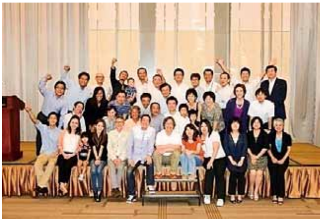
在ホーチミン福岡県人会 (設立：2003年 会員数：100名)