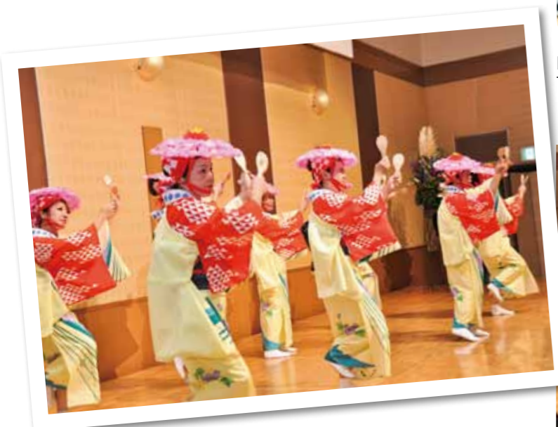
Hakata Folk Dance Society Hakata-dontaku-bayashi dancing