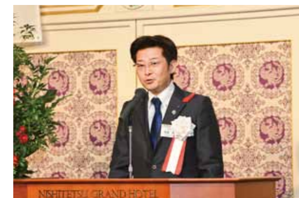
Executive Committee Counselor Chairperson Toshio Matsuo of Fukuoka Prefectural Assembly