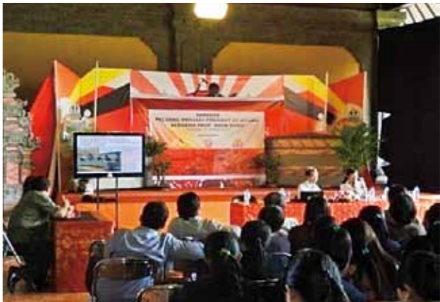
デンパサール福岡会