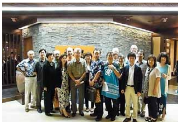
ハワイ福岡県人会 (設立: 1957年 会員数: 152名)