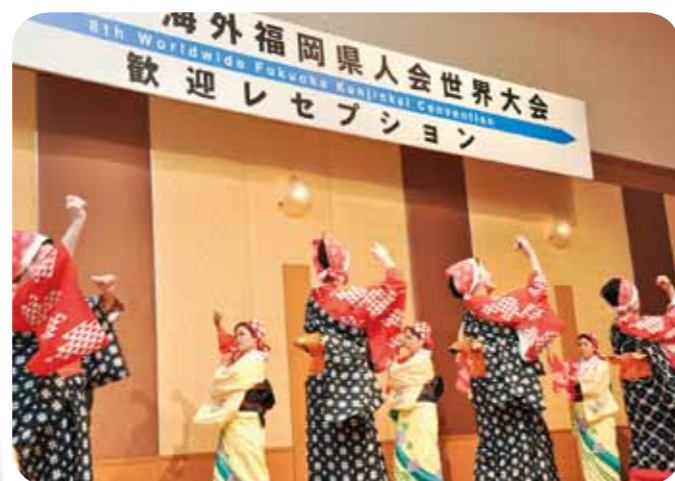
Hakata Folk Dance Society Tanko-bushi dancing