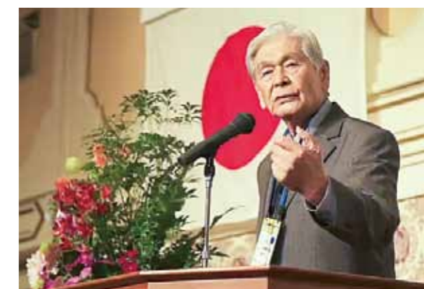
Former Hawaii State Governor George Ariyoshi