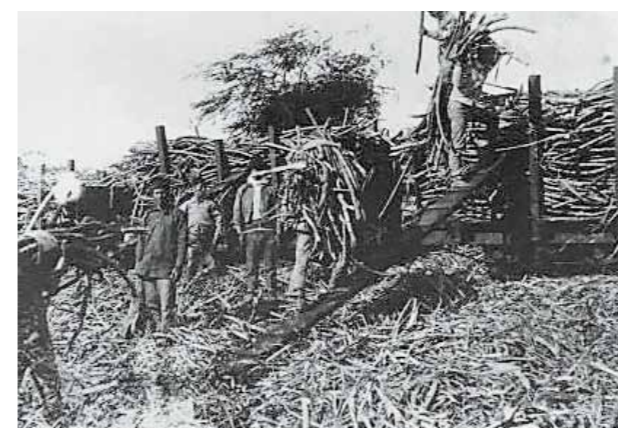
ハワイ、1890年代頃のサトウキビの収穫