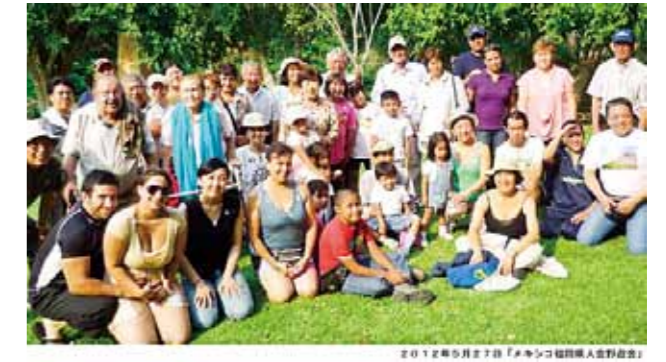
メキシコ福岡県人会 (設立: 1952年 会員数: 142名)