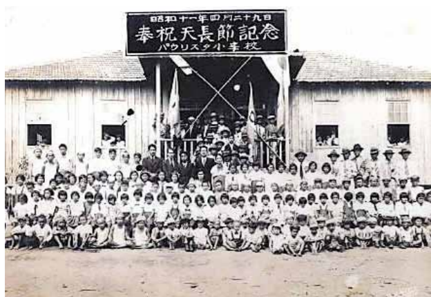
ブラジル、サンパウロ州 (1936年) ベラクルス市の日本人小学校