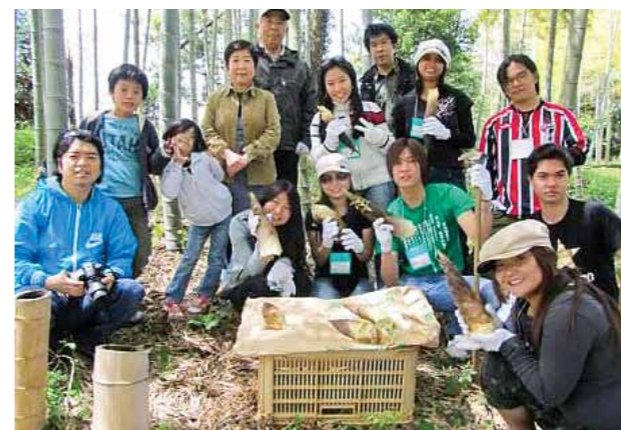
たけのご掘り体験