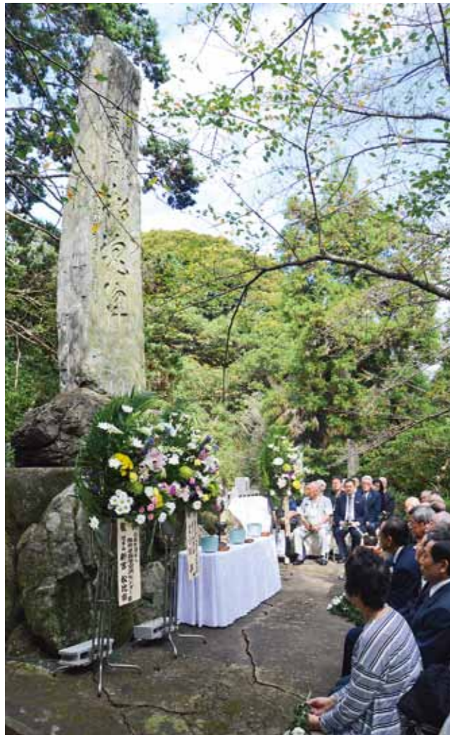
Memorial monument in honor of Japanese people deceased abroad