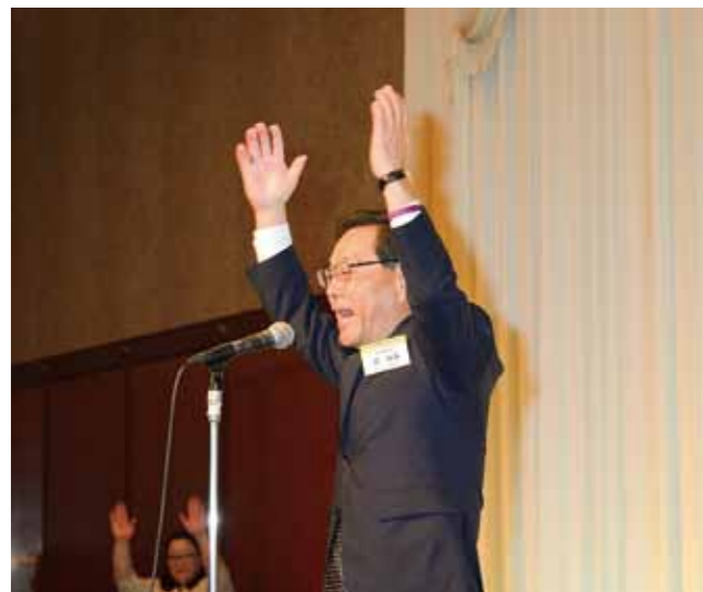
Deputy Chairperson Hiroumi Cho of Fukuoka Prefectural Assembly