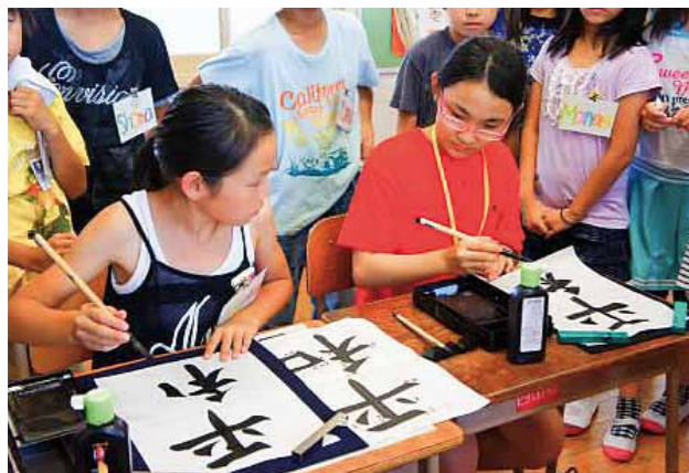
小学校での交流～書道体験