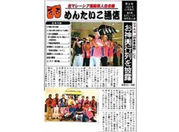
在マレーシア福岡県人会