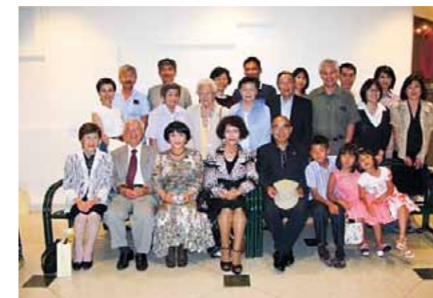
トロント福岡県人会 (設立：1980年 会員数：147名)