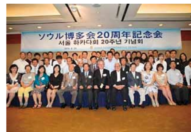
ソウル博多会 (設立: 1990年 会員数: 115名)

アジアや欧州で最近増えてきている福岡県人会の存在は、福岡県人が世界各地で活躍していることを示すものとも言えます。