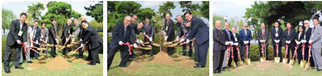
Planting a red flowering Japanese apricot