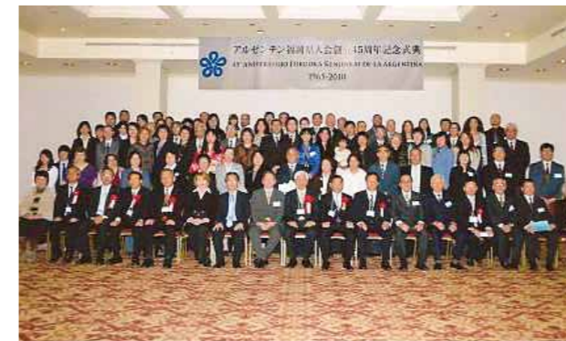
アルゼンチン福岡県人会創立 45 周年 (2010年)