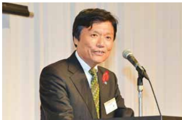
Executive Committee Chairperson Governor Hiroshi Ogawa of Fukuoka Prefecture