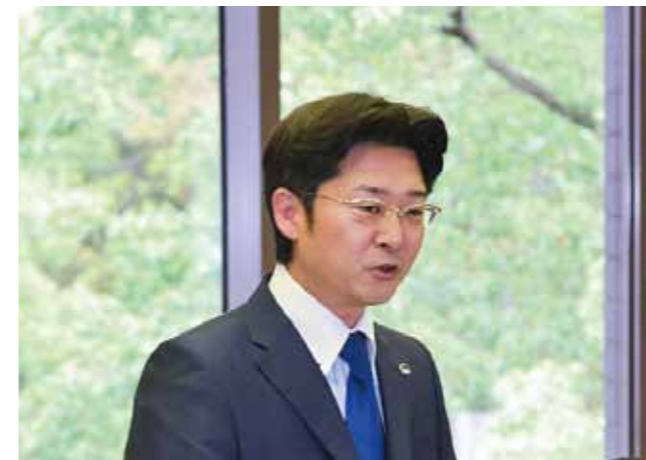
Chairperson Matsuo of Fukuoka Prefectural Assembly welcoming the representatives