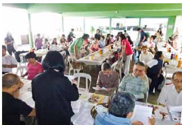
アルゼンチン福岡県人会 (設立: 1965年 会員数: 110名)