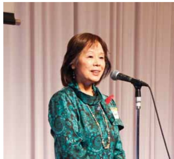
Deputy Governor Etsuko Ebii of Fukuoka Prefecture