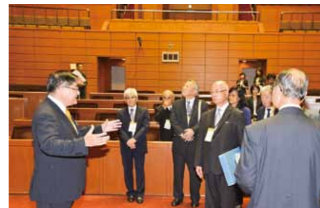
Kenjinkai representatives visiting the Prefectural Assembly Hall