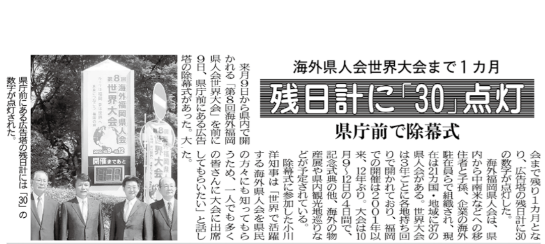
The Nishinippon Shimbun (morning edition), Tuesday, September 10, 2013