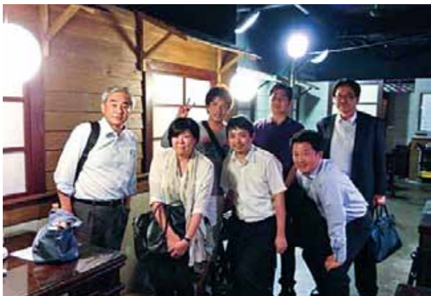
台湾福岡県人会「梅友会」 (設立：2002年 会員数：44名)