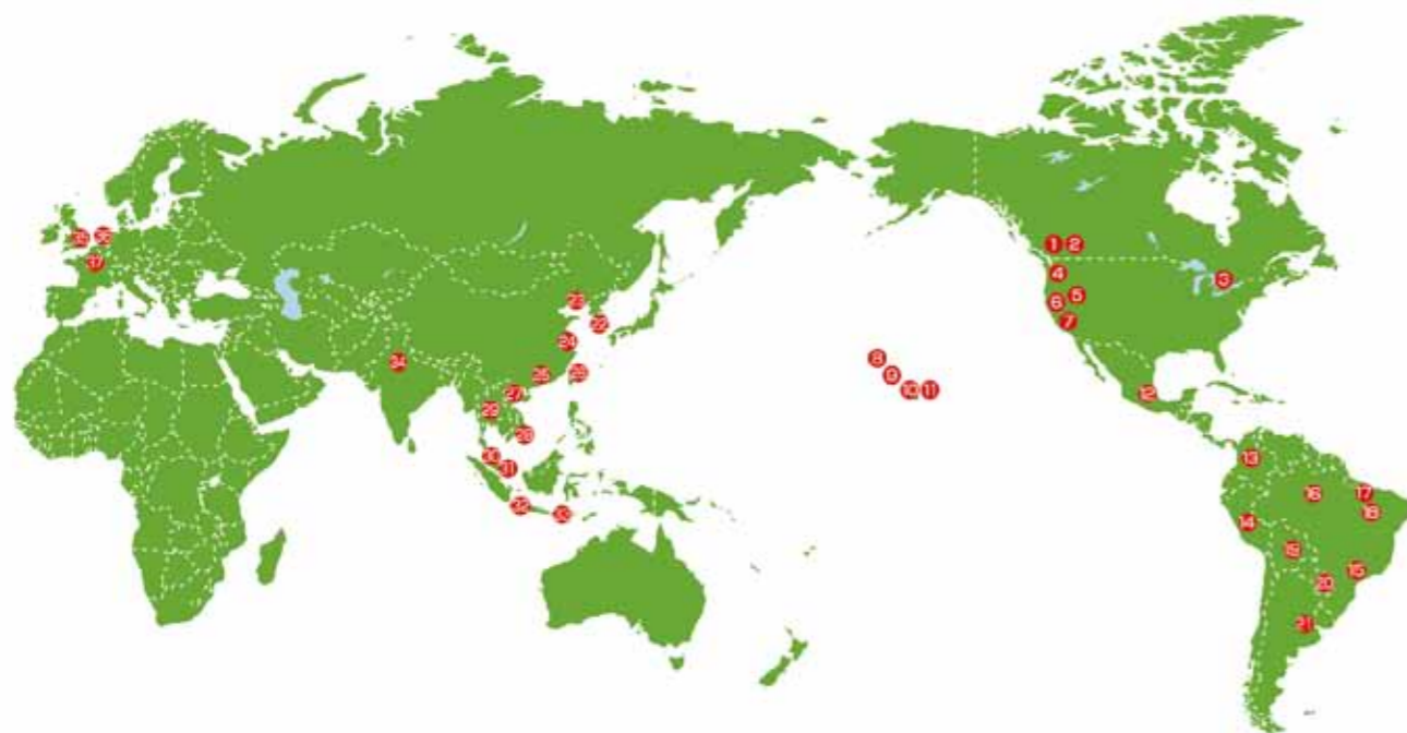
海外の福岡県人会

海外には、福岡県出身の移住者で組織される北米・中南米の県人会や、企業の海外駐在員等で組織されるアジア・欧州の県人会など、37の福岡県人会があります。