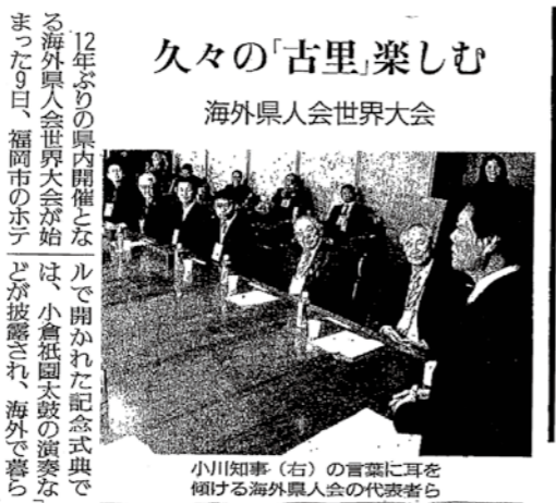
The Yomiuri Shimbun (morning edition), Thursday, October 10, 2013

久々の「古里」楽しむ 海外県人会世界大会 12年ぶりの県内開催となる海外県人会世界大会が始まった9日、福岡市のホテルで開かれた記念式典では、小倉祇園太鼓の演奏などが披露され、海外で暮らす 小川知事(右)の言葉に耳を傾ける海外県人会の代表者ら