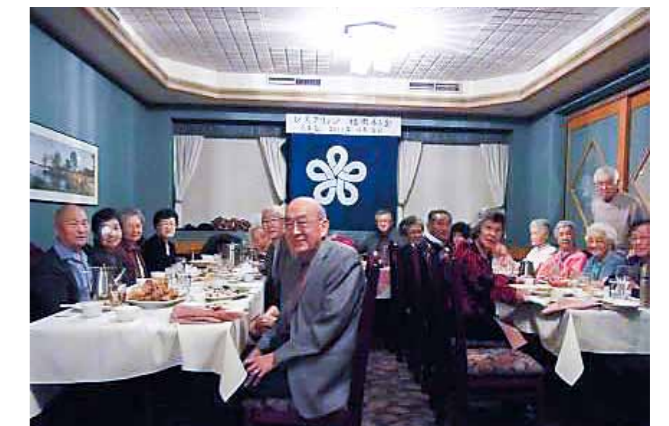
レスプリッジ福岡県人会 (設立：1981年 会員数：46名)