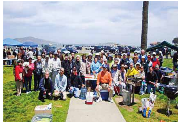
サンフランシスコ福岡県人会 (設立: 1950年 会員数: 222名)