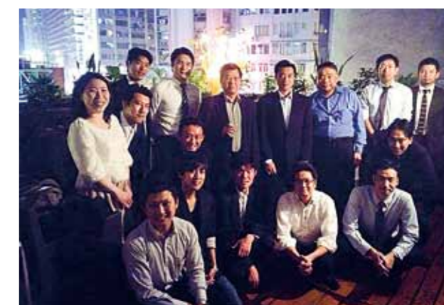
香港福岡県人会 (設立: 1977年 会員数: 120名)