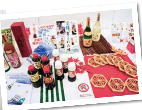
Items provided by municipalities & businesses in Fukuoka Prefecture