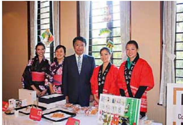
ブラジルでの福岡プロモーション