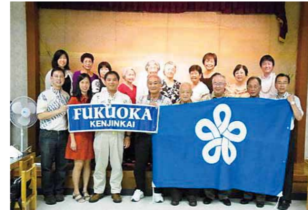
ハワイ島福岡県人会 (設立: 1967年 会員数: 165名)