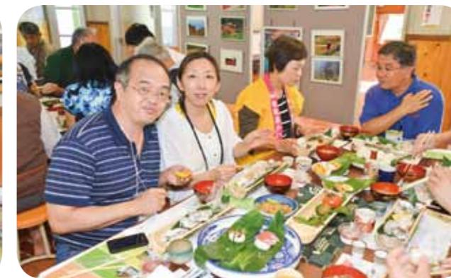
Kawasaki Town Ataka Exchange Center