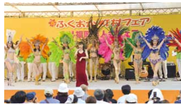
Samba (Ginga Brazil)