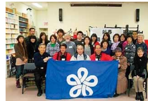
バンケーバー福岡県人会 (設立：1978年 会員数：95名)

福岡県では、県人会との相互交流の促進や県人会の後継者育成の支援を目的とした事業を行い、海外福岡県人会の発展とさらなるネットワークの強化を目指しています。