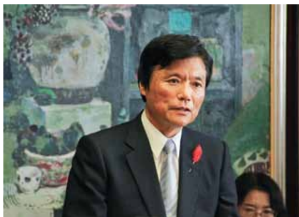
Governor Ogawa welcoming the representatives