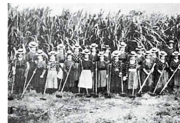
ハワイ、サトウキビ畑で働く日本人