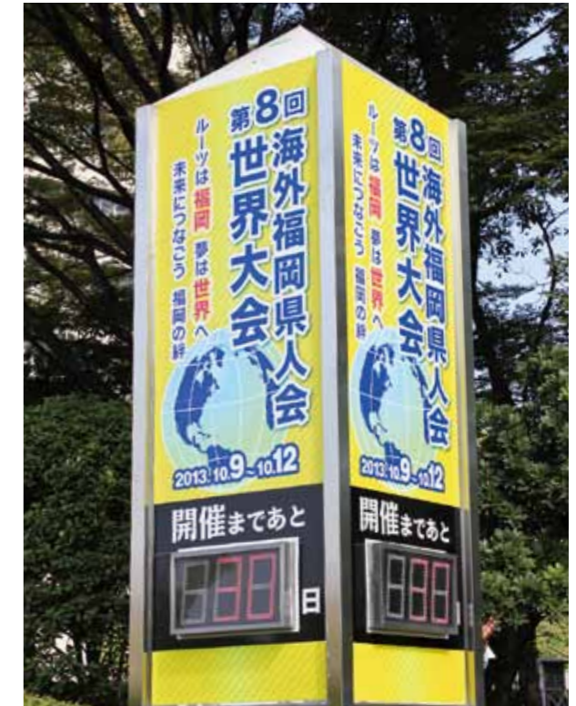
Venue: Fukuoka Prefectural Government Office