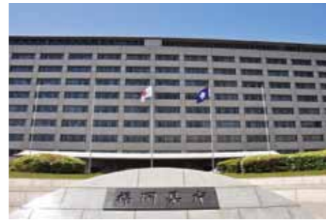
Fukuoka Prefectural Government Office