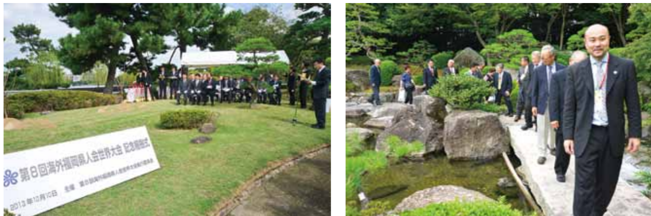
Strolling in the Japanese garden