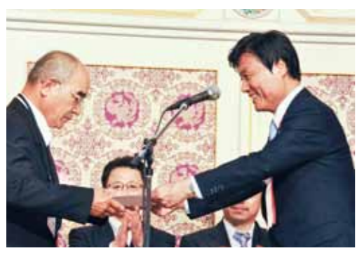
Presenting certificates of appreciation & commemorative gifts