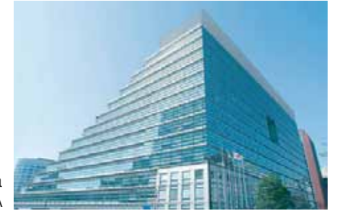
ACROS Fukuoka (C)ACROS FUKUOKA