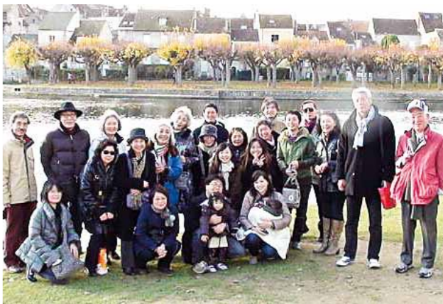
フランス福岡県人会 (設立：1999年 会員数：35名)