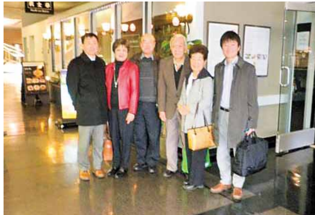
湾東福岡県人会 (オークランド) (設立: 1907年 会員数: 38名)