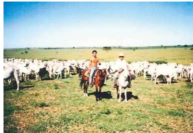
ブラジル派遣農業実習