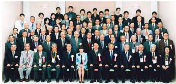
第4回 海外福岡県人会 世界大会 2001年9月10日 福岡