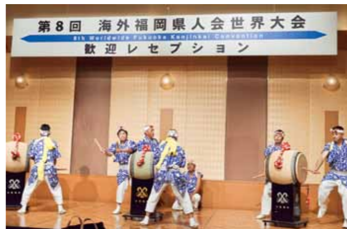
Kokura Gion Daiko by Furusenba 1 & 2 chome teams