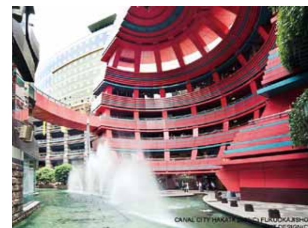
Canal City Hakata