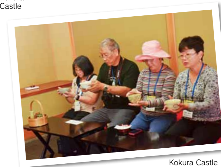
Kokura Castle Garden