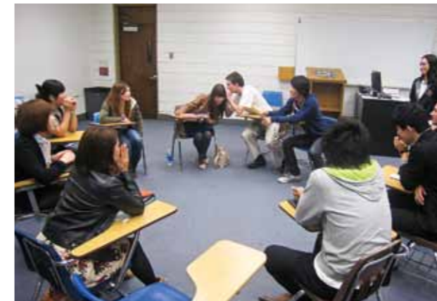
県内大学生のロサンゼルス研修