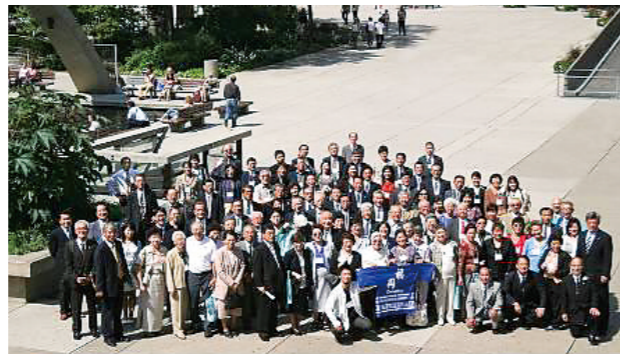
5th Worldwide Fukuoka Kenjin Convention 3-4 September 2004, Toronto, Canada