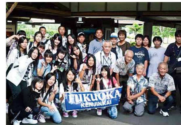
みやこ町海外ホームステイ事業 (ハワイ島)