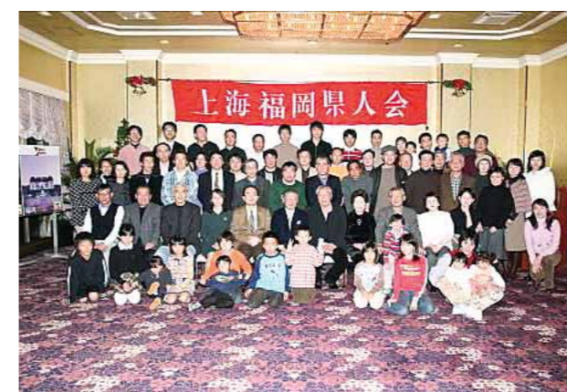
在上海福岡県人会 (設立: 1996年 会員数: 573名)