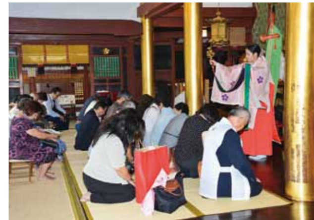
At the Main Shrine