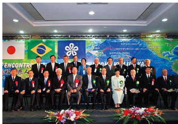
第7回世界大会 (2010年8月、サンパウロ)