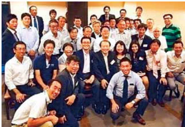
タイ国福岡県人会 (設立：1992年)