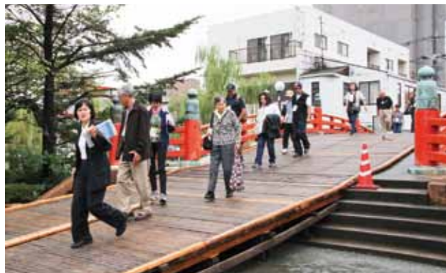
Boat tour on Yanagawa River

Boat tour on Yanagawa River - Ohana - Kyushu Geibun-kan - Jojima Sake Brewery Hana no Tsuyu - Jibasan-Kurume (Kurume Regional Industry Promotion Center)