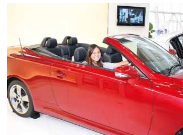
Toyota Motor Kyushu