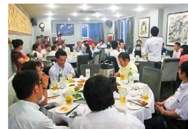
大連福岡県人会 (設立: 1998年 会員数: 106名)