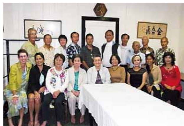
コナ福岡県人会 (設立: 1967年 会員数: 124名)