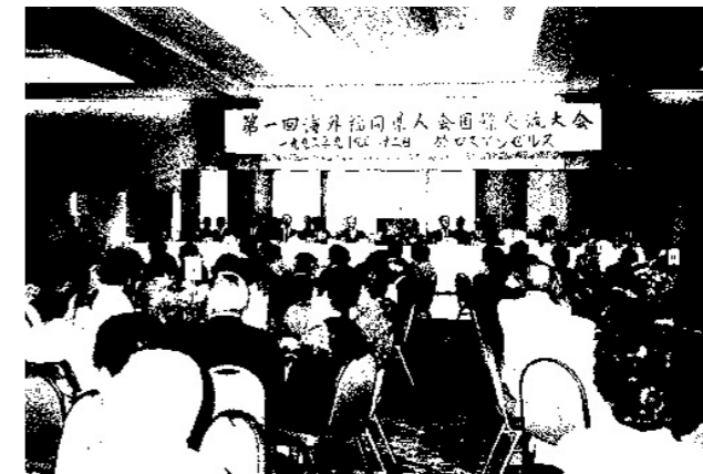
第1回世界大会 (1992年9月、ロサンゼルス)

海外福岡県人会世界大会は、1990年（平成2年）に開催された「とびうめ国体」に各海外福岡県人会が招待された際、県人会同士の交流の場を設けることが提唱されたことを契機に、1992年（平成4年）にロサンゼルスで第1回大会が開催されました。以降、3年に一度開催され、福岡県との絆を深めています。