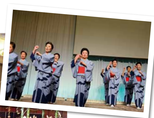
Seicho-tanko-bushi Dancing Conservation Society