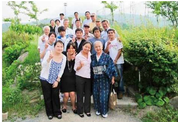
福岡県海外移住家族会の皆さんと