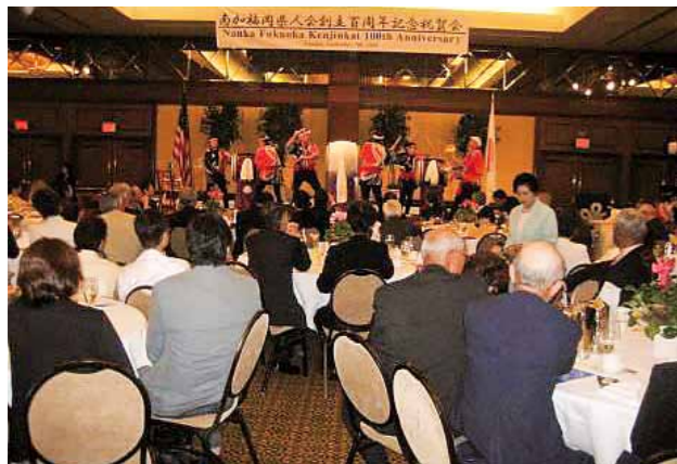
南加福岡県人会創立 100 周年 (2008年)