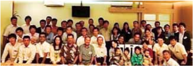
インドネシア福岡県人会「飛び梅会」 (設立：1999年 会員数：163名)