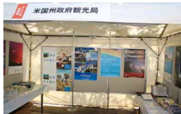
U.S. State Office of Travel and Tourism