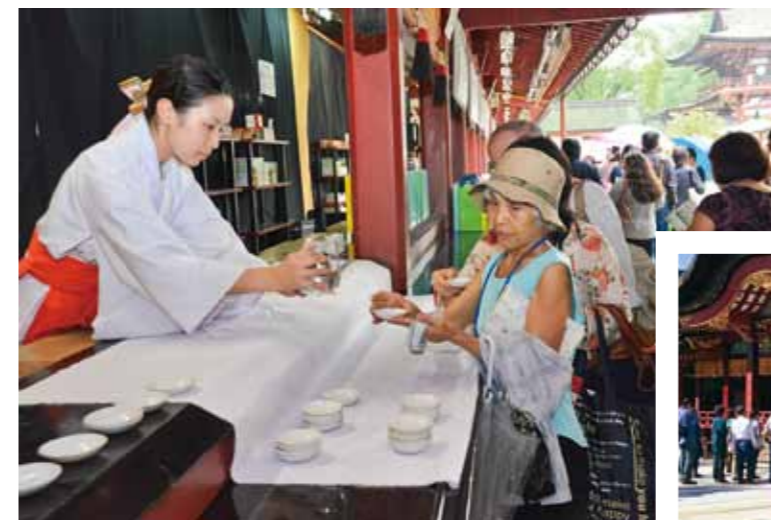
Receiving sacred sake