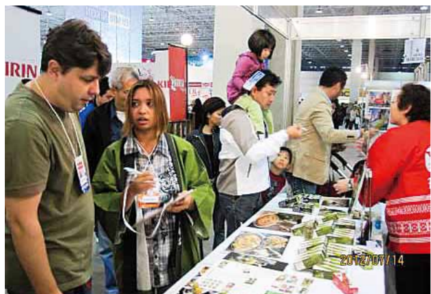
サンパウロ「日本祭り」で福岡県産品を紹介