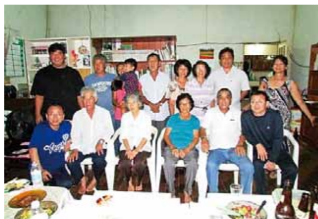
トメアスー福岡県人会 (ブラジル) (設立: 1975年 会員数: 16名)