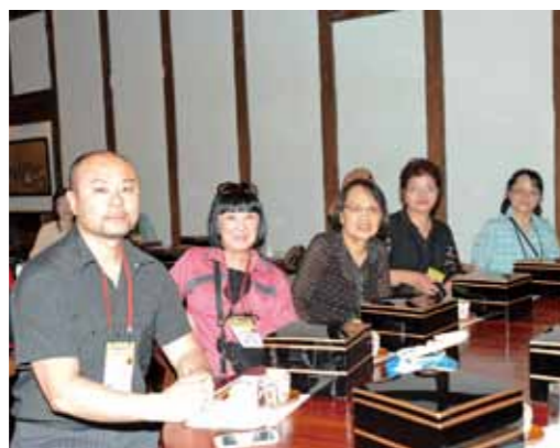
Hakata Hyakunengura Sake Brewery