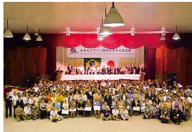
日本人アマゾン移住 80 周年 (2009年)