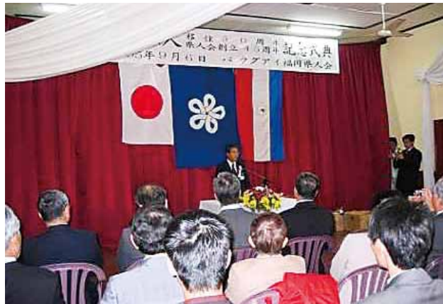
パラグアイ福岡県人会創立 45 周年 (2005年)

移住周年記念式典や県人会創立記念式典等に、福岡県からも訪問団が参加し、県人会との結びつきの強化に努めています。