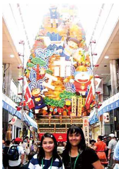
博多祇園山笠見学