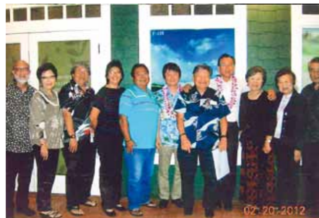
カウアイ福岡県人会 (設立: 1985年 会員数: 40名)