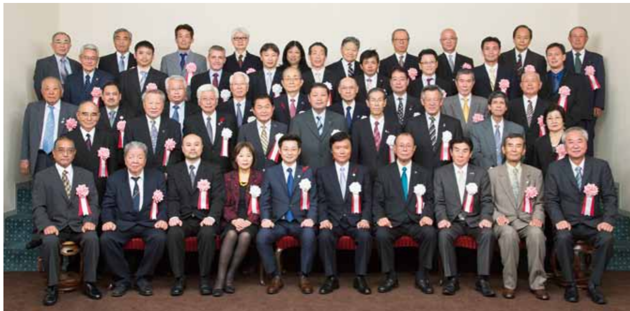
Commemorative photo at the commemorative ceremony for the 8th Worldwide Fukuoka Kenjinkai Convention