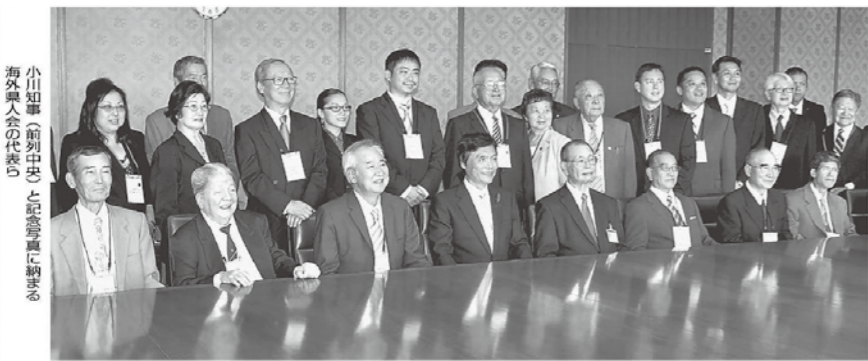
The Yomiuri Shimbun (morning edition), Thursday, October 10, 2013