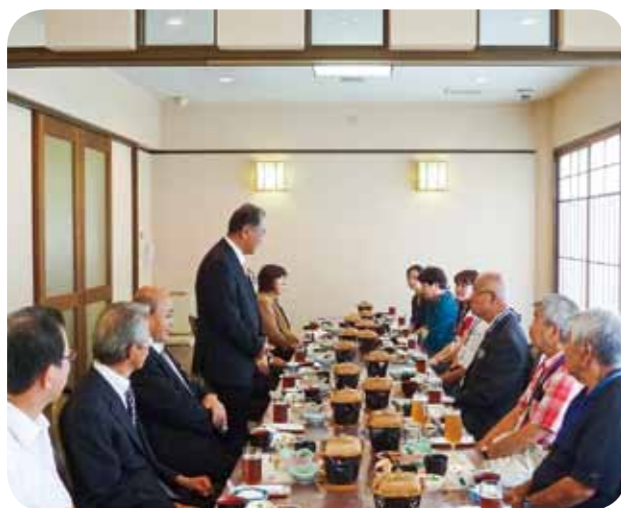
Lunch at Bengara-mura