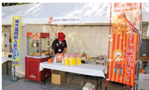
U.S. cuisine: Jerry's Popcorn