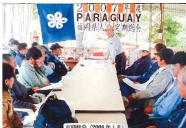
パラグアイ福岡県人会 (設立: 1958年 会員数: 220名)