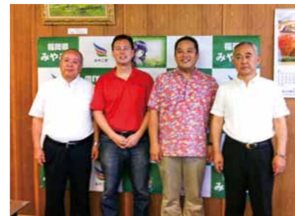
Together with Mayor Yukiharu Inoue of Miyako Town