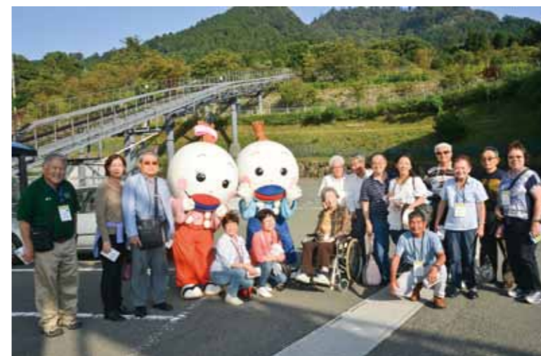
Commemorative photo with Soeda Town's "Hiko-chan" and "Yuzu-chan"