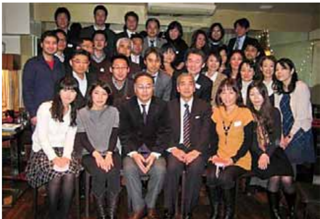
英国福岡県人会 (設立：1980年 会員数：約80名)