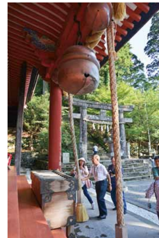
Hikosan Hoheiden Hall