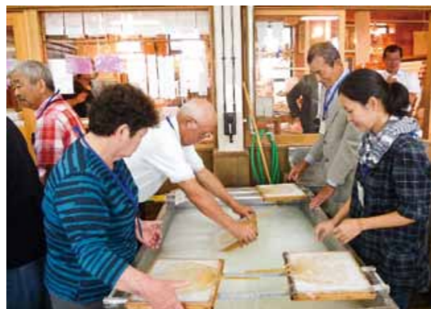
Hand paper-making at the Yame Traditional Craftwork Center