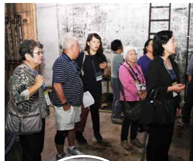
Jojima Sake Brewery Hana no Tsuyu