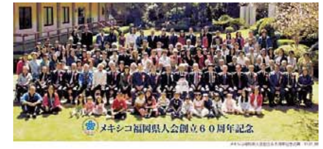
メキシコ福岡県人会創立 60 周年 (2011年)