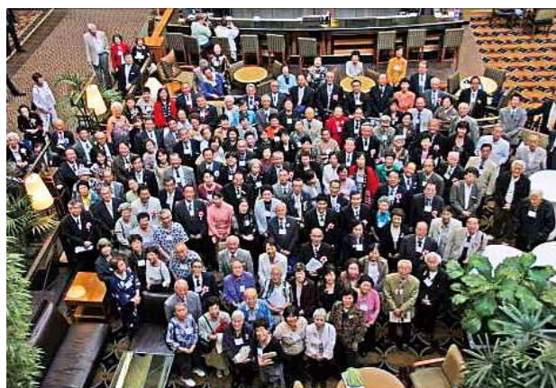
第6回世界大会 (2007年8月、シアトル)