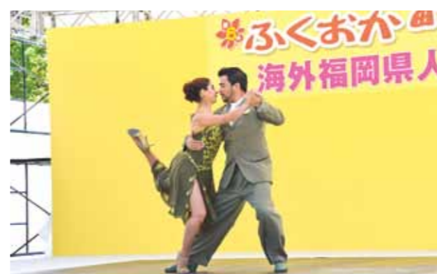
Argentinian tango, guitar, Latin dance performances (Tiempo Iberoamericano)