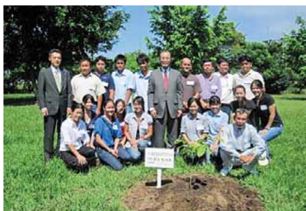
在ボリビア福岡県人会 (設立: 1973年 会員数: 36名)