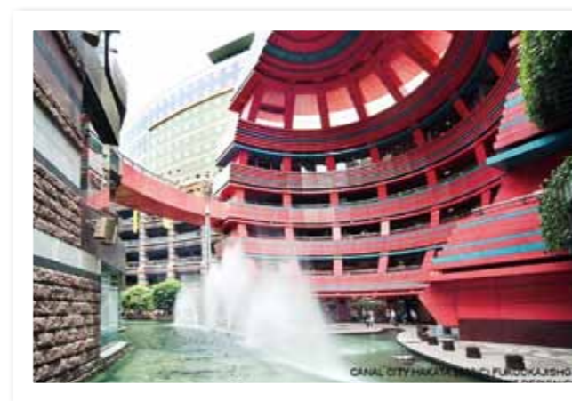
Canal City Hakata