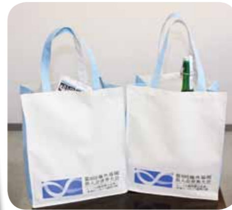
Souvenir packages for participants (Products donated by local governments businesses)