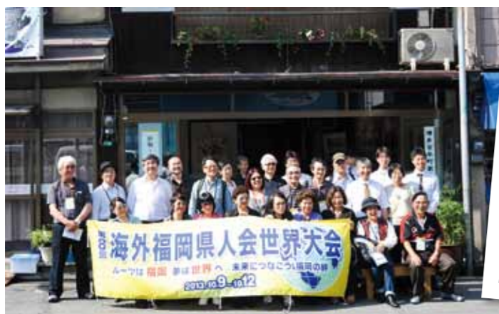
Hakata Hyakunenmachiya House