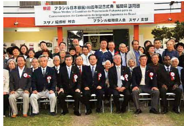
ブラジル日本移民 100 周年 (2008年)