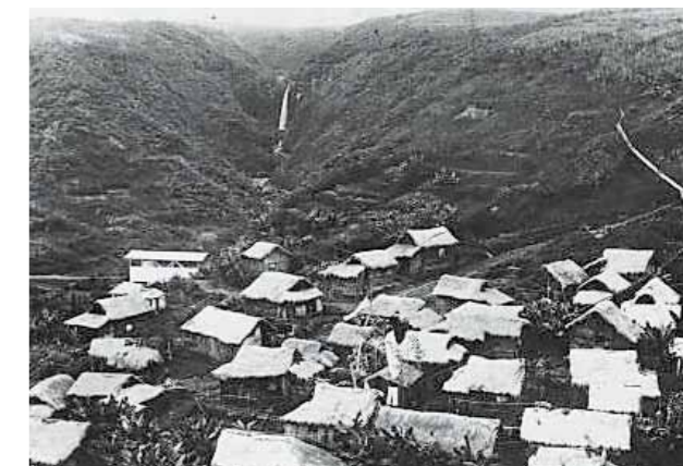
ハワイ、ヒロ郊外のプランテーション村落