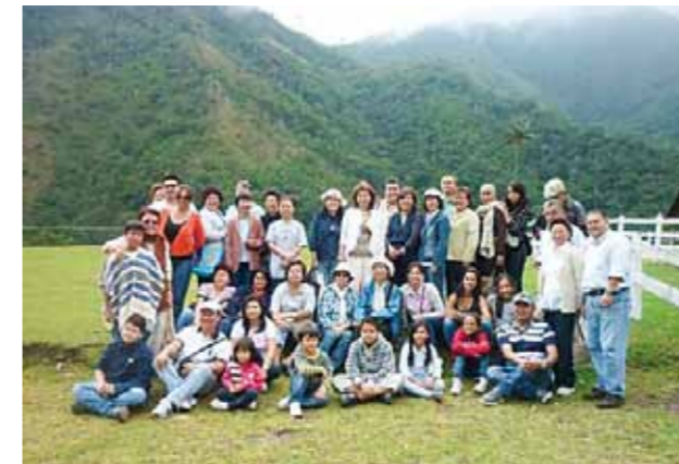
コロンビア福岡県人会 (設立: 1978年 会員数: 129名)