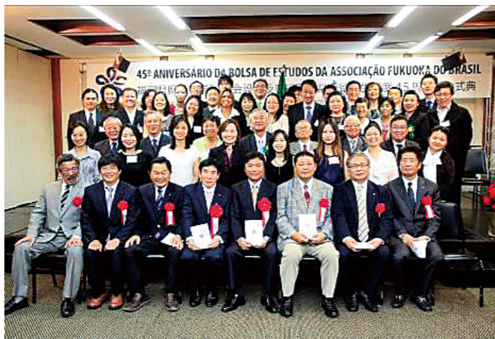
ブラジル県費留学生OB会設立記念式典（2012年）

200名以上の留学生を送り出してきたブラジルでは、2012年（平成24年）9月に、県費留学生OB会が設立されました。また、留学生OBが会長を務める県人もあり、後継者育成の成果を上げています。次を担う世代と福岡県との新たな交流の拡大が期待されています。