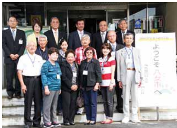
Yame City Government Office

Yame City Government Office – Yame Traditional Craftwork Center – Bengara-mura – Stroll through Yame – Dinner party