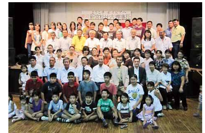
ポリビア福岡県人会との交流 (2013年)