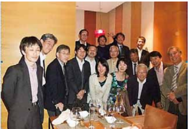
デリー福岡県人会 (設立：2009年 会員数：40名)