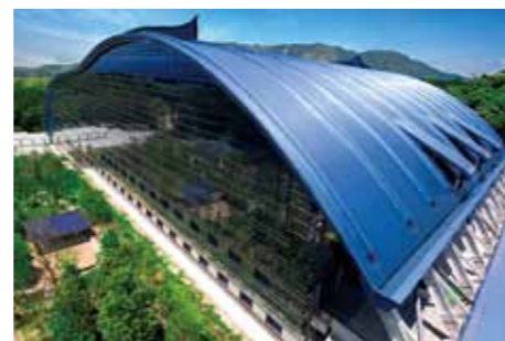
Kyushu National Museum