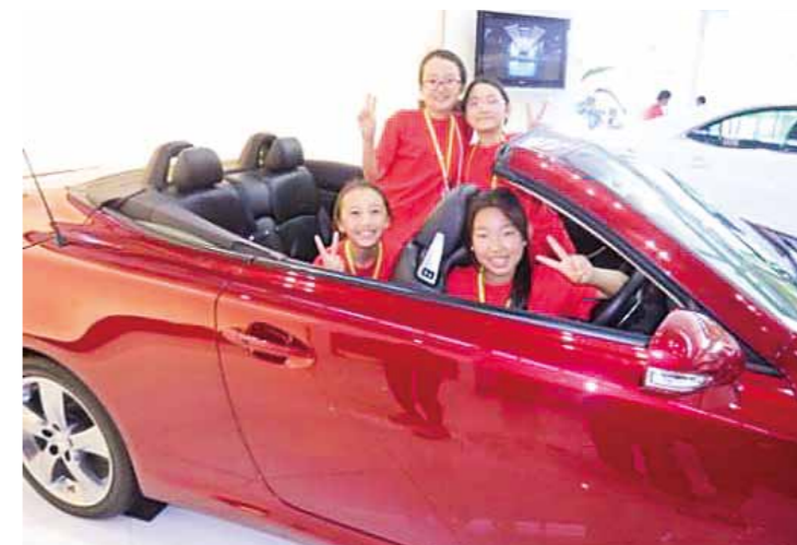
トヨタ自動車 九州工場見学