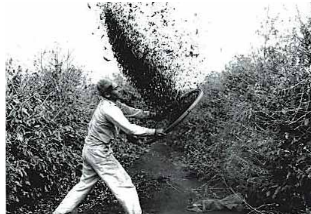
ブラジル、パラナ州 (1930年代頃) 収穫されたコーヒー豆を振るいかけする農夫