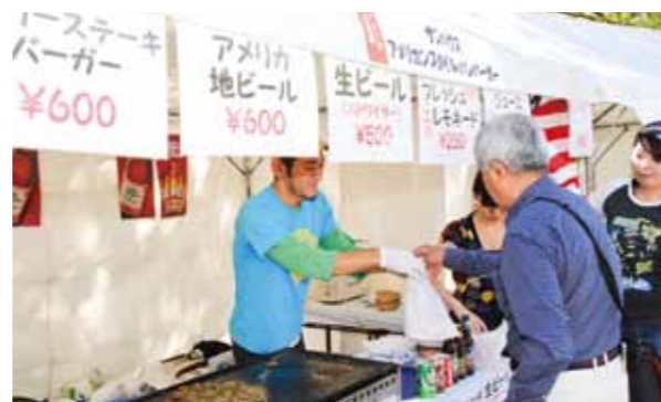
U.S. cuisine: Sun House Hamburger