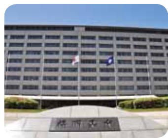
Fukuoka Prefectural Government Office