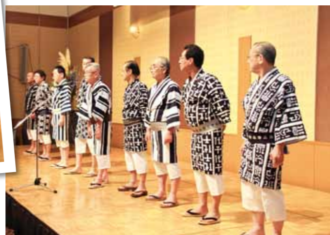
Iwai-medeta performance by Hakata Gion Yamakasa Promotion Association