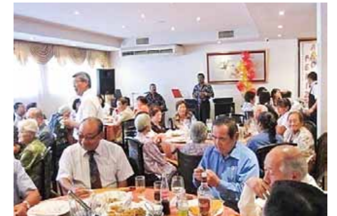
ペルー福岡クラブ (設立: 1959年 会員数: 600名)