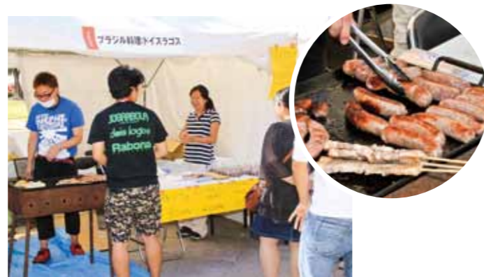
Brazilian cuisine: dois lagos