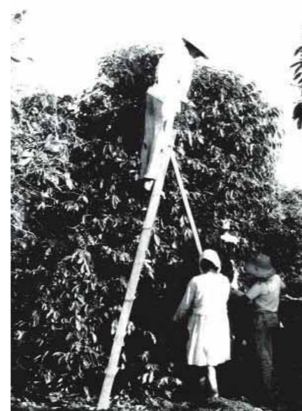
ブラジル、サンパウロ州 (1940年代頃) 手作業によるコーヒー豆の穫り入れ