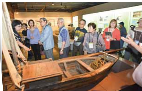
Tagawa City Coal Mining/History Museum