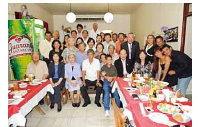
マナウス福岡県人会 (ブラジル) (設立: 1959年 会員数: 102名)