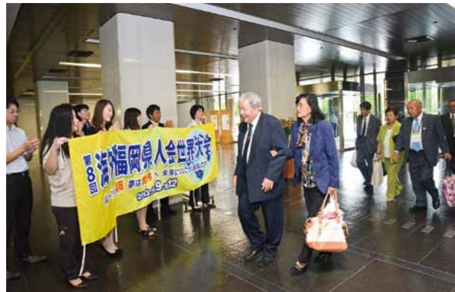
Kenjinkai representatives arriving at the Fukuoka Prefectural Government Office