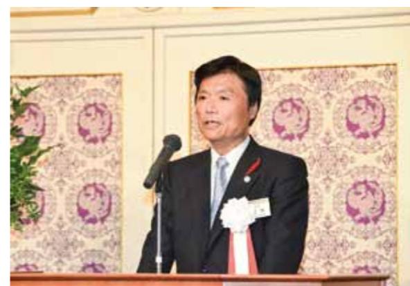
Executive Committee Chairperson Governor Hiroshi Ogawa of Fukuoka Prefecture