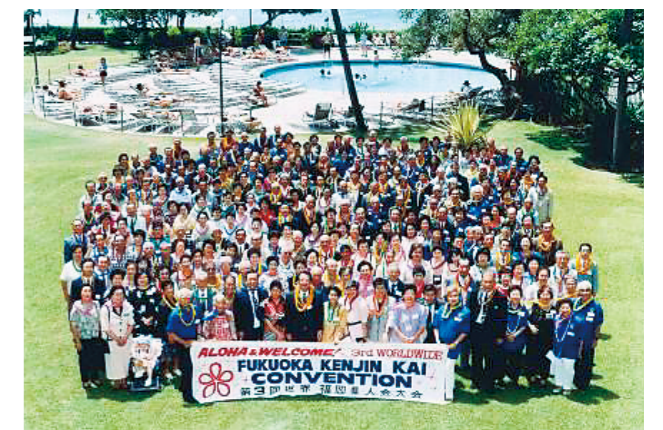
第3回世界大会 (1998年9月、ホノルル)