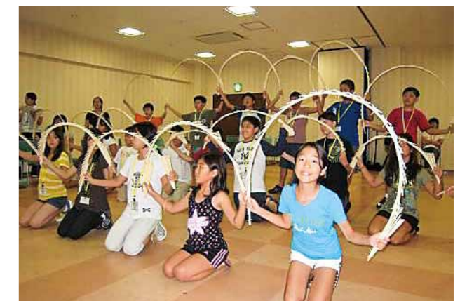
南京玉すだれに挑戦