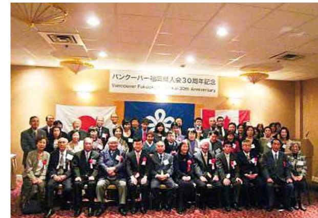
バンクーバー福岡県人会創立 30 周年 (2010年)