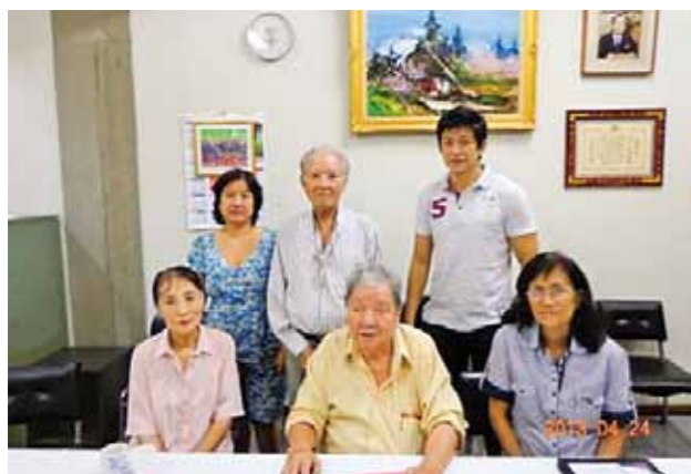
ペレン福岡県人会 (ブラジル) (設立: 1969年 会員数: 60名)