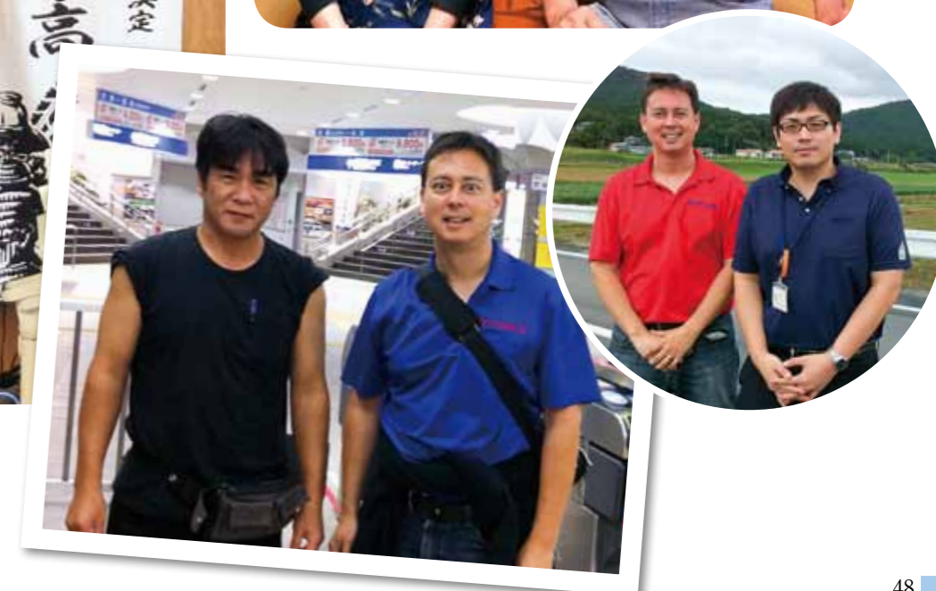
With staff from the Miyako Town Hall