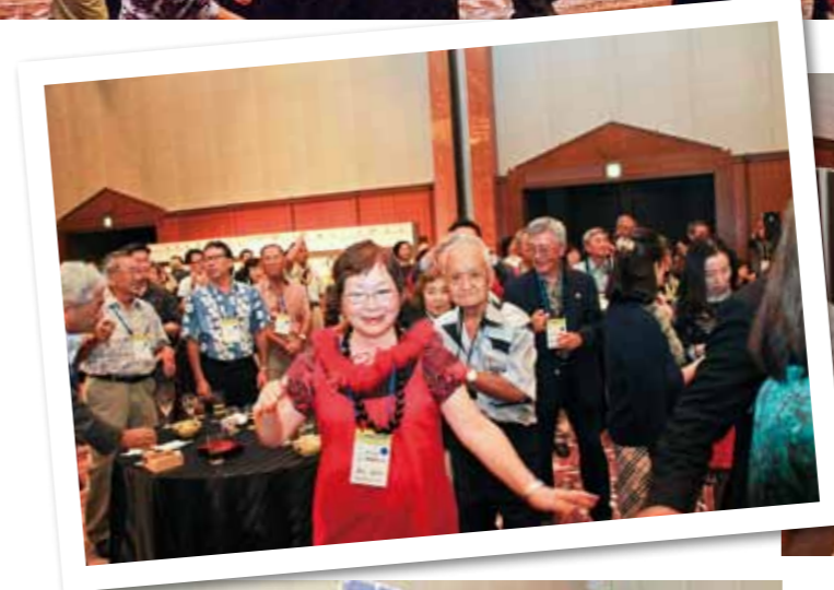
Everyone joining in the tanko-bushi dance