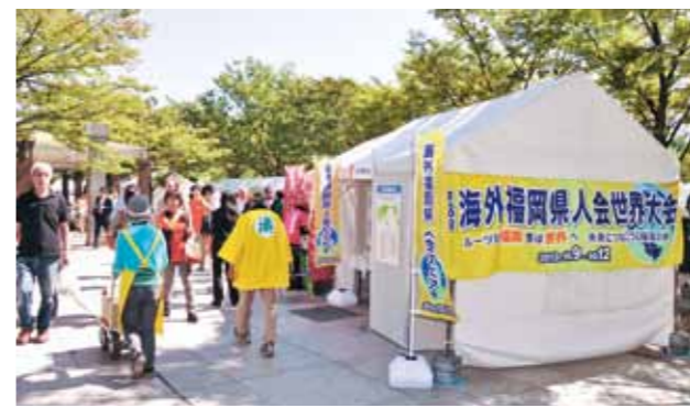
Introduction of the various Kenjinkai and the history of migration