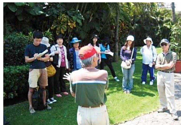
県内大学生のメキシコ派遣研修