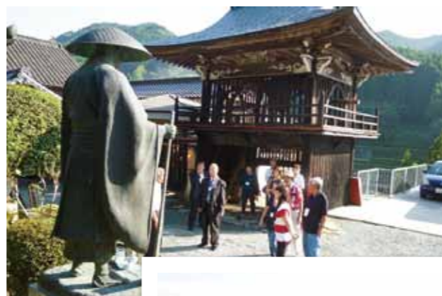
Strolling through Yame City