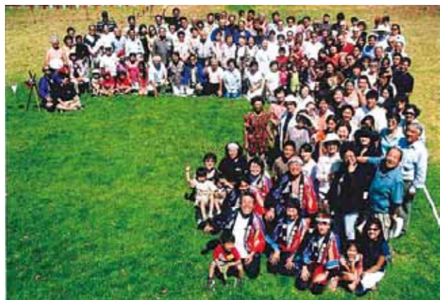
南加福岡県人会 (ロサンゼルス) (設立: 1908年 会員数: 560名)