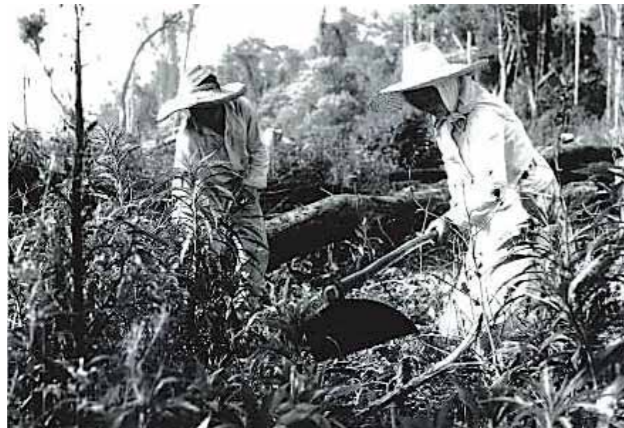
ブラジル、サンパウロ州 (1920年代頃) 自分達の土地を自力で耕そうとする移住者