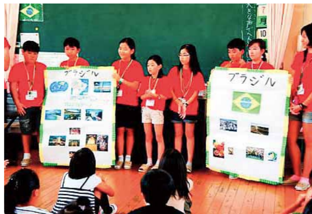
小学校での交流～自国の紹介