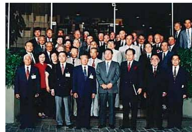
第2回世界大会 (1995年9月、サンパウロ)