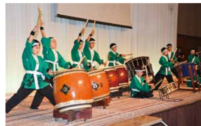
Japanese drum performance by Brazil Mika Taiko