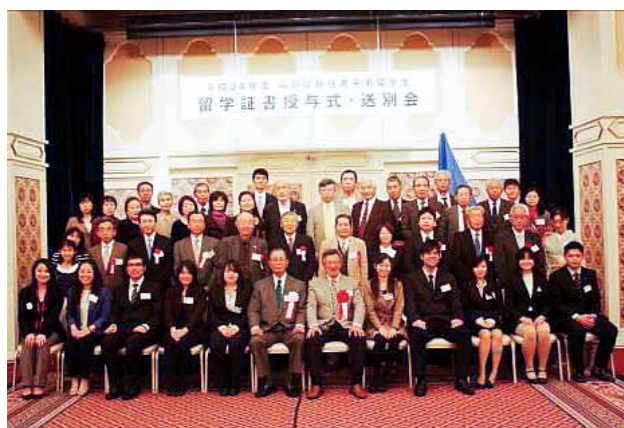
留学証書授与式・送別会