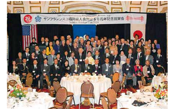
サンフランシスコ福岡県人会創立 60 周年 (2010年)