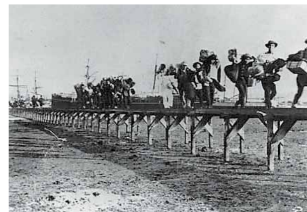
ハワイ、ホノルルに到着した日本からの移住者

戦後には、ブラジルのアマゾン河流域、パラグアイ、ボリビアなどへの移住が始まりました。福岡県からの移住者の人数は、全国で4番目に多く、約5万6千人に達しています。