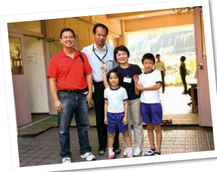
Visit to Miyako Town Irahara Elementary School