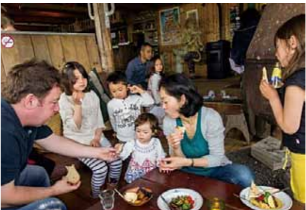
オランダ福岡県人会 (設立：2006年 会員数：20名)