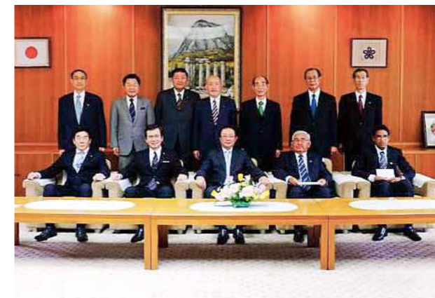
ペルー福岡クラブ会長一行の福岡訪問 (2013年)