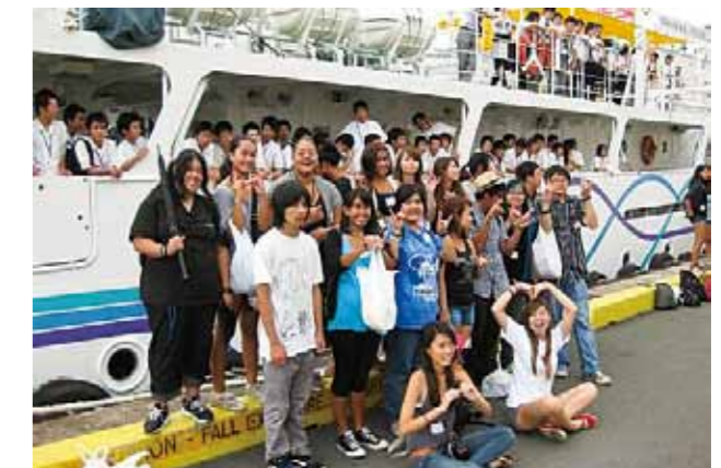
県立水産高校実習船ハワイ交流事業