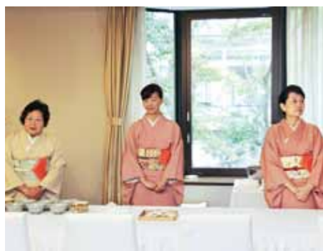
Sampling Japanese tea