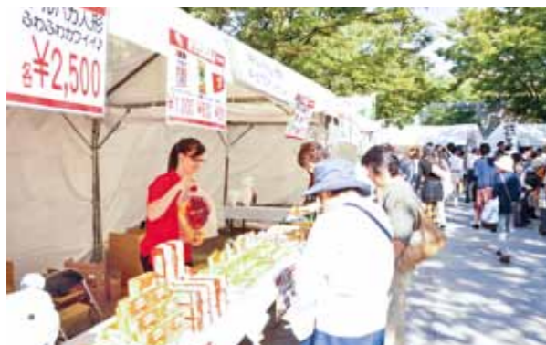
Central and South American cuisine: KYODAI