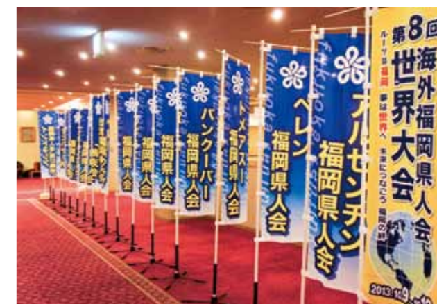
Banners of Kenjinkai organizations