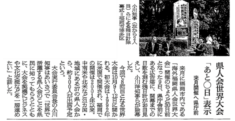
The Asahi Shimbun (morning edition), Wednesday, September 11, 2013