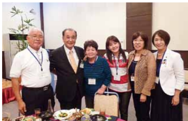
Together with Mayor Tsuneyuki Mitamura of Yame City