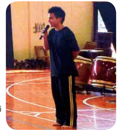
Greeting from Hakata Osshoi Taiko