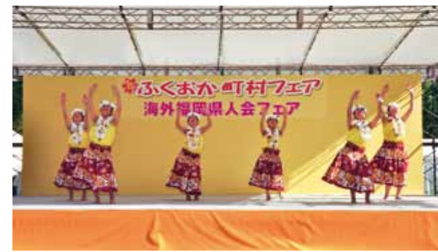
Hula by Mino'aka CJ Girls, Chikushi Jogakuen High School