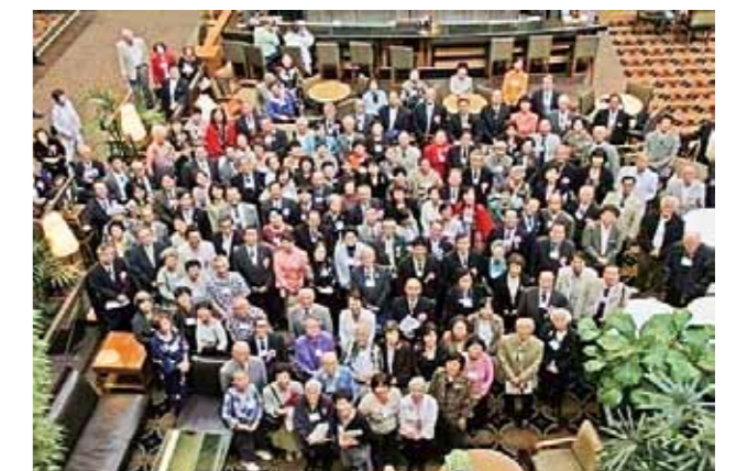
シアトル・タコマ福岡県人会 (設立：1907年 会員数：91名)