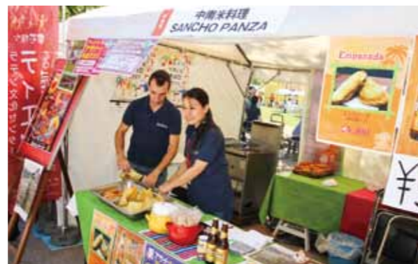
Central and South American cuisine: Sancho Panza