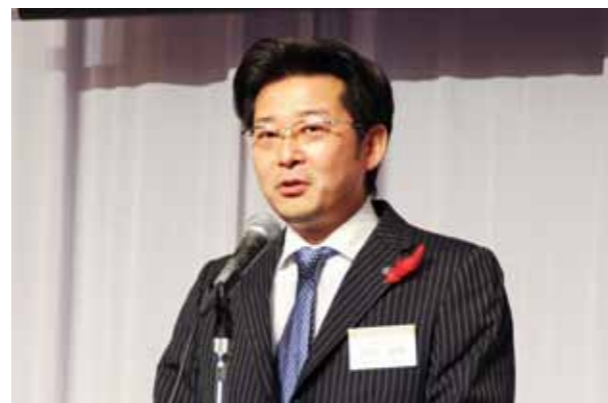
Executive Committee Counselor Chairperson Toshio Matsuo of Fukuoka Prefectural Assembly